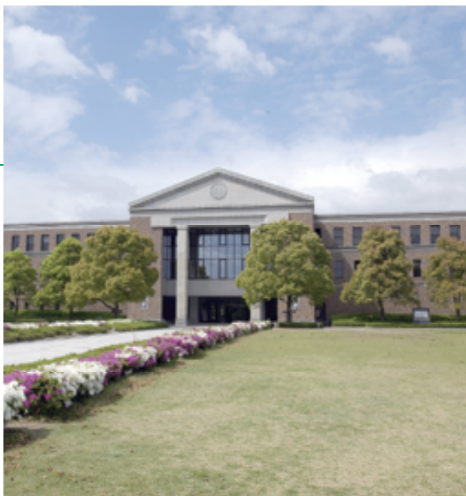
现在来自中国的200名以上的留学生在本校就读!

同志社大学自1875年创立,有着悠久的历史,也是日本最具代表性的私立大学之一。创建者新岛 襄以国际主义、与基督主义的精神为基础,建立了学校。教育理念为「良心之全身ニ充满シタル丈夫ノ起り来ラン事ヲ」,现在被同志社的人们代代相传。本校主体完全面向世界,欢迎各国学生来此进修。到2006年4月1日,有着9个学部11个研究别科和留学生别科(日本語教育中心)、专业、人文、社会、自然科学的全部知识传授给大家。